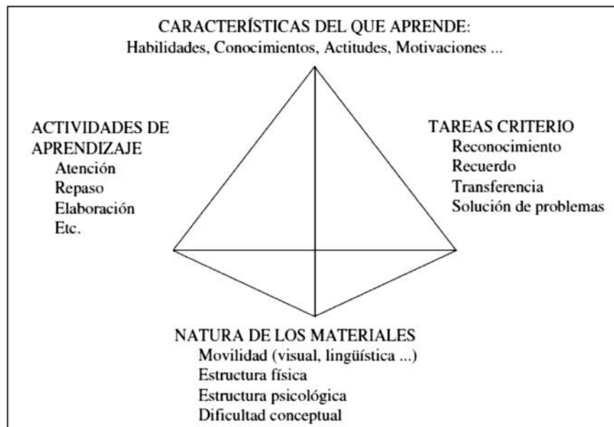
Figura 3. Modelo de aprendizaje (Jenkins, 1979. Adaptado por Brown, 1982)

- Cuestionario de Evaluación de la Metodología del Humor. La evaluación de la experiencia se llevó a cabo por medio de un cuestionario que cumplimentaron los alumnos al finalizar el curso. Esta evaluación se diseñó siguiendo el modelo de Jenkins (1979) (adaptado por Brown, 1982), el cual tiene en cuenta los cuatro factores que intervienen en una situación de aprendizaje: las características del aprendizaje, las características del que aprende, la naturaleza de los materiales y la tarea criterio. Consideramos que el análisis de cualquier proceso de aprendizaje necesita tener en cuenta todos estos factores y las posibles interrelaciones que puede haber entre ellos (ver Figura 3).