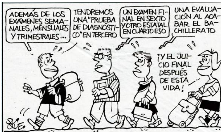
Figura 1. Ejemplo viñeta cómica sobre el tema de las reválidas introducidas por la LOMCE

- Viñetas gráficas. El empleo del humor gráfico a través de viñetas en el tratamiento de temas educativos constituye una vía pedagógica alternativa que provoca la reflexión y promueve una mejor comprensión de los mismos, al tiempo que hace sonreír. Las viñetas que hemos utilizado, han sido extraídas del Periódico educativo Escuela Española y han sido diseñadas por «Quique». Éstas tratan temas de actualidad desde un punto irónico. En la Figura 1 se puede observar un ejemplo de las viñetas presentadas a los alumnos para su posterior análisis.