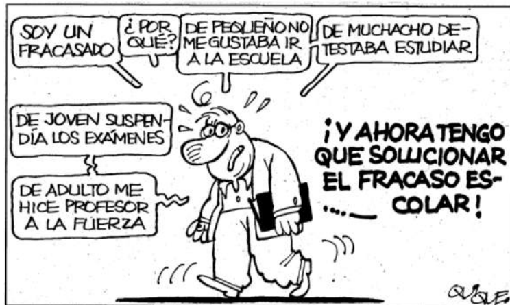
Figura 2. Ejemplo viñeta cómica sobre el tema de la motivación y la formación del profesorado

- Humor escrito y verbal. De manera espontánea o intencional podemos utilizar el humor verbal o escrito a través del chiste en situaciones en donde la praxis educativa lo admite. Entendemos por chiste todo aquello que hábil y conscientemente hace surgir la comicidad, sea de idea o de la situación (Lipps, 1998). Vinculado al humor verbal, hemos intentado desarrollar en nuestros alumnos habilidades para mejorar su oratoria.